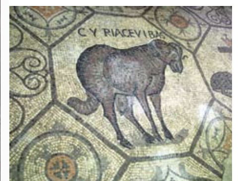
Mosaik „Widder“ in der Krypta