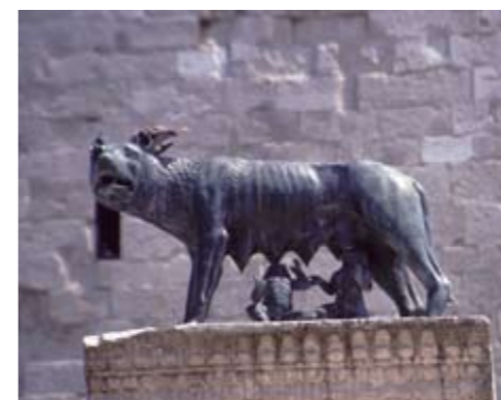
die kapitolinische Wölfin auf dem Platz vor der Basilika